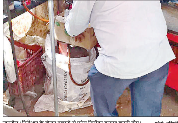
नारनौल। निरीक्षण के दौरान दुकानों से घरेलू सिलेंडर बरामद करती टीम।

माध्यम से आपूर्ति निर्बाध रूप से जारी है। सोमवार को ही विभिन्न प्लांटों से जिले की एजेंसियों को 1962 नए सिलेंडर प्राप्त हुए, जिससे कुल उपलब्ध स्टॉक बढ़कर 6140 हो गया था। उपायुक्त ने बताया कि सोमवार को जिले भर में 4637 ऑनलाइन बुकिंग प्राप्त हुई थी, जिनका वितरण कार्य तत्परता से किया गया।