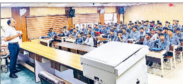
नारनौल। विद्यार्थियों को विशेष व्याख्यान देते हुए लेक्चरर।