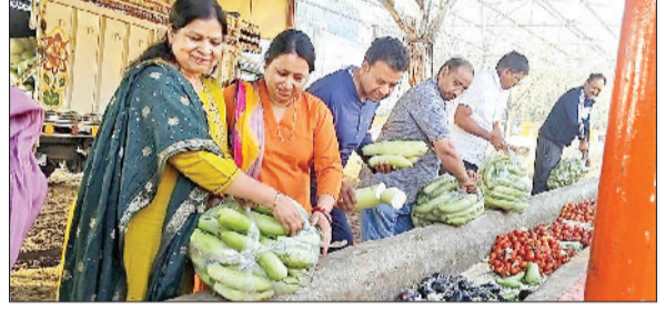
नारनौल। गोवंश के लिए समवाणी लगाते हुए।