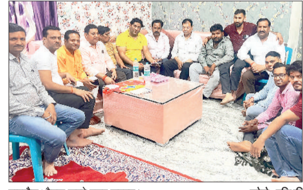
नारनौल। बैठक करते क्लब सदस्य।