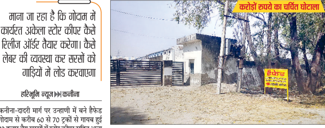
कनीना। उन्हाणी स्थित हैफेड गोदाम, जहां से सरसों के हजारों बैग गायब।

माना जा रहा है कि गोदाम में कार्यरत अकेला स्टोर कीपर कैसे रिलीज ऑर्डर तैयार करेगा। कैसे लेबर की व्यवस्था कर सरसों को गाड़ियों में लोड करवाएगा कनीना-दादरी मार्ग पर उन्हाणी में बने हैफेड गोदाम से करीब 60 से 70 ट्रकों से गायब हुई 12 हजार बैग सरसों में स्टोर कीपर सहित अन्य कर्मचारियों पर भी शक की सुई घूम रही है। आमजन में इस बात की चर्चा चली हुई है, जिसे लेकर तरह-तरह के सवाल खड़े हो रहे हैं। माना जा रहा है कि गोदाम में कार्यरत अकेला स्टोर कीपर कैसे रिलीज ऑर्डर तैयार करेगा। कैसे लेबर की व्यवस्था कर सरसों को गाड़ियों में लोड करवाएगा। क्या वास्तव में गोदाम में इतनी सरसों थी या नहीं अथवा यूं ही स्टोर कीपर के सिर पर टीकरा फोड़ा जा रहा है। गोदाम में सरसों थी, तो यह पूरा प्रकरण एक दिन में संभव भी नहीं हो सकता। इस