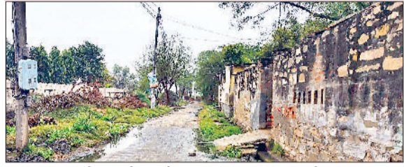
निजामपुर। सरेली गांव की फिरनी व नालियों में जमा दूषित पानी।