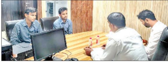
नारनौल। प्लेसमेंट ड्राइव में भाग लेते नौकरी के इच्छुक उम्मीदवार।